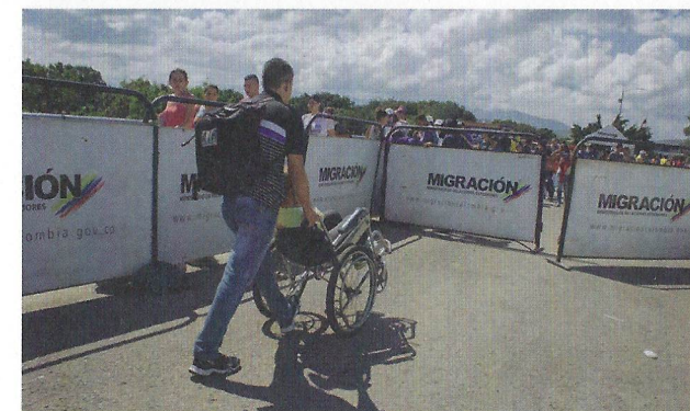
Venezolaner verlassen ihr Heimatland.

„MILLIONEN MENSCHEN SIND GEZWUNGEN ALLES ZURÜCKZULASSEN, UM DEN MASSIVEN MENSCHENRECHTSVERLETZUNGEN IM LAND ZU ENTFLIEHEN. DARUNTER FALLEN WILLKÜRLICHE INHAFTIERUNGEN, AUSSERGERICHTLICHE HINRICHTUNGEN, FOLTER SOWIE VERLETZUNGEN DES RECHTS AUF NAHRUNG UND MEDIZINISCHE VERSORGUNG.“