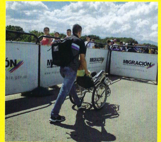
Flucht aus Venezuela